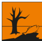
N - Dangereux pour l'environnement