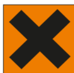
Xn - Nocif