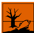
N - Dangereux pour l'environnement