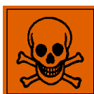
T - Toxique